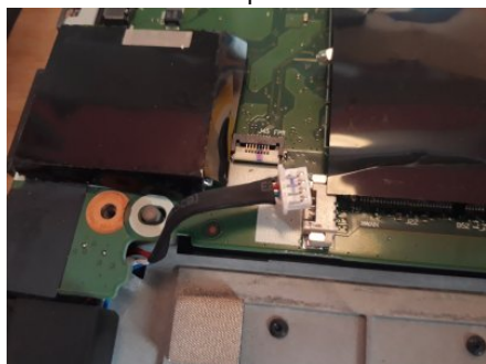
Dévisser et retirer le SSD