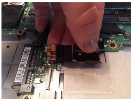
Débrancher le haut-parleur