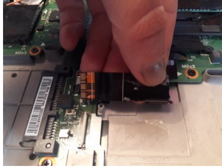
Débrancher le haut-parleur