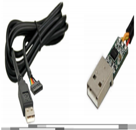
Cable FTDI USB-Série.

Pour fabriquer ce câble, nous nous sommes largement basés sur le tutoriel de Daviworks (lien ci-dessous).