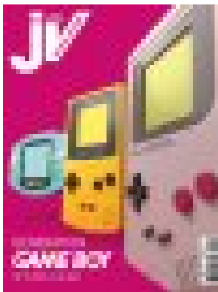
JV Hors série #15